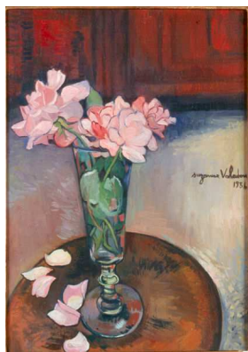
Rose dans un verre Suzanne Valadon