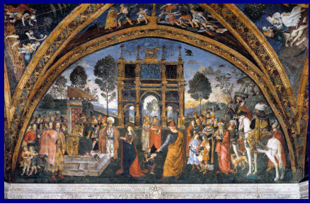
Fresque de Sainte Catherine d'Alexandrie- Musées du Vatican Bernardino di Betto dit Le Pinturicchio (1454-1513) vers 1494

Depuis le XVème siècle les membres de la famille Borgia ont fait couler beaucoup d'encre, en particulier, trois de ses membres : le pape Alexandre VI et deux de ses enfants, César et Lucrece. Si leurs noms sont associés aux pires turpitudes, aux crimes les plus abominables, on doit toutefois leur reconnaître de réelles qualités d'audace, de courage, un grand sens politique dans une époque de profondes mutations qui a vu basculer l'Occident du monde médiéval aux Temps modernes. Comment les membres de cette obscure famille espagnole ont-ils pu se hisser au plus haut de la hiérarchie sociale, atteindre une célébrité qui fascine toujours autant le grand public et continuer de stimuler la création artistique.