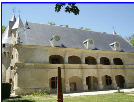
La façade du château