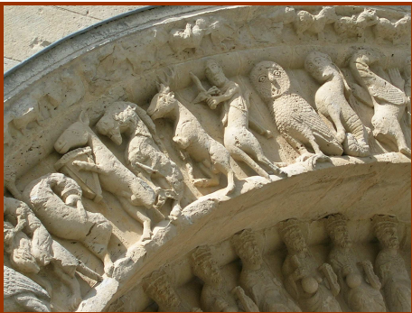
Détail du portail sud Saint Pierre d'Aulnay de Saintonge

L'église Saint-Pierre à Aulnay (en Charente-Maritime) est célèbre pour son remarquable décor sculpté qui se développe tant à l'extérieur qu'à l'intérieur. Elle est inscrite sur la liste du patrimoine mondial, au titre des chemins de Saint-Jacques dont elle est un des jalons