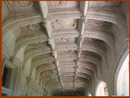
La Galerie avec son plafond à caissons- Château de Dampierre sur Boutonne

Les pièces remeublées, les combles du château sont accessibles en visite guidée. Un espace est dédié aux grands aventuriers-explorateurs, artistes et poètes de la Renaissance avec les portulans artistiques de Ghislaine Escande (et ses œuvres réalisées à partir des livres brûlés de la bibliothèque), des cartes anciennes, miniatures, gravures et curiosités mis en scène dans 5 salles communicantes accessibles par un nouvel escalier et un ascenseur. Les jardins, recréés dans l'esprit Renaissance et en référence aux décors de la galerie, sont une réinterprétation par 12 artistes contemporains de 28 des 93 caissons. Ils se présentent comme un ensemble "mythologique et alchimique" de trois parcours initiatiques et un labyrinthe avec gloriottes, charmilles, buis, sculptures :