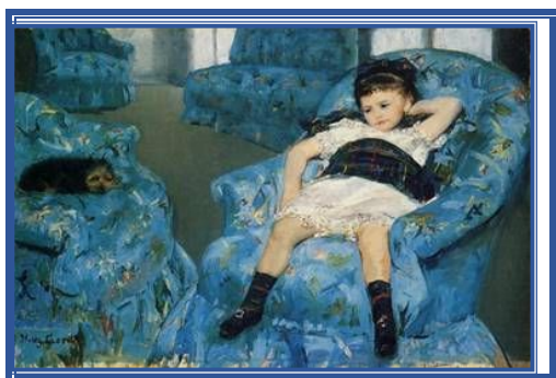
Mary Cassatt : Petite fille dans un canapé bleu, 1878, Washington, National Gallery of Art

Mary Stevenson Cassatt est née dans une riche famille bourgeoise, près de Pittsburgh, aux Etats-Unis, en 1844. A peine âgée de sept ans, elle découvre l'Europe, en famille. Elle y revient et s'installe en France, en 1865, pour poursuivre des études artistiques commencées à Philadelphie. Elève de Charles Chaplin puis de Jean-Léon Gérôme, elle débute au Salon de 1868. Elle quitte la France au moment de la guerre de 1870 mais est de retour dès la fin de l'année suivante. Refusée au Salon de 1877, elle rejoint le groupe impressionniste auquel elle se lie dès lors, participant à ses expositions et promouvant le mouvement aux Etats-Unis. Demeurée fidèle à la France, elle meurt en 1926 dans son château du Mesnil-Théribus, dans l'Oise. Peintre et graveur, portraitiste et auteur de nombreuses scènes de genre, Mary Cassatt laisse une œuvre abondante, claire et joyeuse, même si souffle parfois sur elle la rigueur de son éducation protestante.