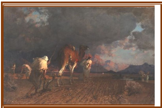
Gustave Guillaumet Le labour

Au cours de sa brève et brillante carrière (il disparaît à 44 ans), il retourne à dix reprises en Algérie, où de longs séjours au plus près des populations locales, dans les villages ou sous la tente, lui permettent d'approfondir le regard qu'il porte sur ce pays et ses habitants. Cette conférence propose de découvrir la vie et la personnalité de ce peintre attachant, fasciné par la noble simplicité des sociétés traditionnelles, et d'appréhender l'itinéraire artistique de cet artiste « orientaliste » parfois qualifié de « peintre ethnographe » ou de « Millet algérien », excellent connaisseur des paysages et des cultures locales, qui renouvelle radicalement leur représentation. À partir de l'évocation du contexte historique de la création de Guillaumet, du Second Empire à la Troisième République, et de celle de