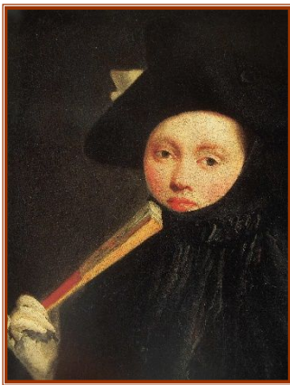
Giovanni Battista Tiepolo Femme au Tricorne-1760

Cette conférence est réservée aux amis du musée des Beaux-Arts ou aux adhérents de l'association Dante Alighieri.