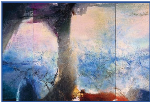
Zao Wou Ki- Hommage à Claude Monet février-juin 91 – Triptyque, 1991