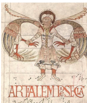
Troaire - prosier de Saint Martial de Limoges, vers 1029

En février, trois rencontres au musée des Beaux-Arts avec les artistes et professionnels du monde de l'émail, de l'enluminure et de la sculpture, pour s'y essayer ou pour parler de leur pratique et vécu personnel en écho à l'héritage historique de l'abbaye Saint-Martial.