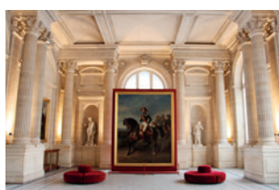
Le Musée des Beaux Arts