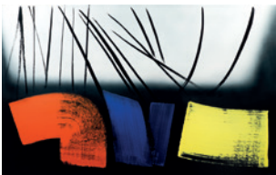
Hans Hartung, T1973-E12, 1973. Acrylique sur toile. 154 x 250 cm Fondation Gandur pour l'Art, Genève © Fondation Gandur pour l'Art, Genève © ADAGP, Paris, 2019 Photo : Sandra Pointet