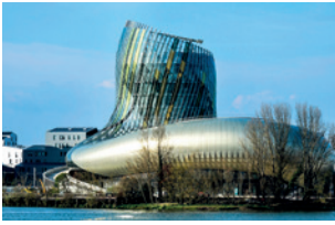
La Cité du vin