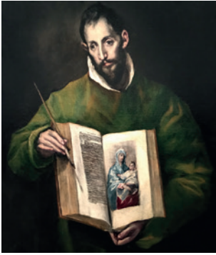
Le Greco, Domenikos Theotokopoulos, Saint Luc, v. 1602-05, Huile sur toile, H. 0,98 ; L. 0,72, Toledo, Catedral Primada (détail)