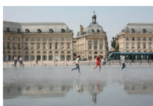
Place de la Bourse

Le Musée des Beaux-Arts de Bordeaux est un musée d'art fondé en 1801 et principalement constitué d'une collection de peintures allant du XV e au XX e siècle mais qui possède également des collections de sculptures et d'arts graphiques.