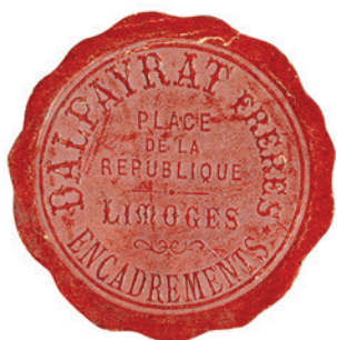
Sceau de la Galerie Dalpayrat, vers 1910, Coll. part.

* En raison du partenariat entre les Amis du Musée des Beaux-arts de Limoges et les Amis du Musée Adrien Dubouché, cette conférence sera réservée aux adhérents de l'une ou l'autre de ces deux associations.