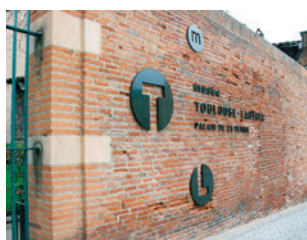
Musée Toulouse Lautrec